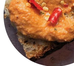
Tavola Dei Briganti

87010 Sant'Agata Di Esaro Italia, Sant'agata di esaro, Italy